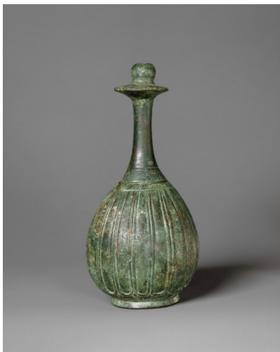
Obr.11 Perirrhanterion z obdobia helenizmu, druhá polovica 4.storočia pred Kr.

Hydria z gr. hydor , čo znamená voda, boli veľké nádoby s tromi uchami. Dve horizontálne na nosenie a jedno vertikálne na liatie vody. Ikonografia a samotná funkcia v bežnom živote nasvedčuje tomu, že hydrie používali prevažne ženy na prenášanie vody, ktorú naberali z verejne prístupných fontán či studní. Hydrie boli využívané najmä na bežné potreby domácnosti, keď si v nich ženy prinášali vodu do svojich domácností. Ďalšie použitie vody bolo zrejme podobné dnešnému, na varenie alebo domáce práce. V helenizme boli využívané aj ako urny. 203 Niekoľko nádob sa našlo v Paeste, v Magne Grécii v hrobách žien, v mužských sa však nenašla ani jedna. 204 Ak hovoríme o využití hydrii je potrebné podotknúť, že grécky bežný život sa nezaobišiel bez náboženskej stránky a ani tu nemôžeme jednoznačne povedať, že hydrie sú čisto praktickou záležitosťou bez významnejšej role v gréckom prostredí. Hydrie boli využívané aj pri kultových obradoch. Ich prepojenie je aj vďaka ikonografii jednoduchšie, či už sa jedná o zobrazenia hydrii