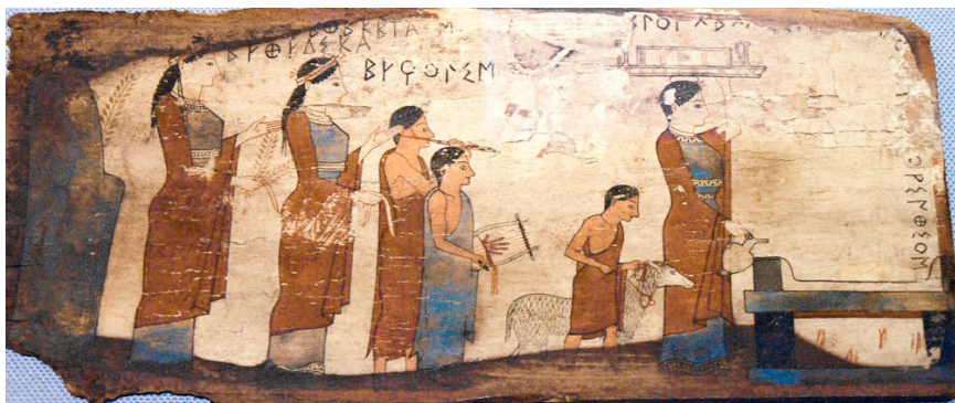
Obr.3 Sprievod vedúci k vykonaniu obety zobrazený na drevenej tabuľke z dediny Pitsa pri Korinte. Datovaný do 6.storočia pred Kr.

Vo svätyniach bývali pravidelne verejné aj mystérijné oslavy, ktoré sa konali vždy v rámci posvätného okrsku. Najčastejšie sa konali každé dva alebo štyri roky. Tie najvýznamnejšie svätynie počas sviatkov navštevovalo veľa ľudí a účasť na oslavách bývala pomerne vysoká. 117 Do chrámu vstupoval človek individuálne alebo pri takýchto spoločných udalostiach. Individuálne potreby privádzali veriacich do chrámov a očista bola v rukách každého z nich. Museli sa držať predpisov o očiste, ktoré stanovovali chrámy jednotlivo. Pri národných sviatkoch, hrách, či festivalov bola návšteva chrámu samozrejmosťou. Pri účasti na oslavách, ktoré zahŕňali rôzne úkony, sprievody, obetovania, sa zúčastnili aj očisty. Takže pri tejto návšteve chrámu už veriaci absolvovali celý proces osláv a tým aj očistu, ktorú završili obetou v posvätnom okrsku.