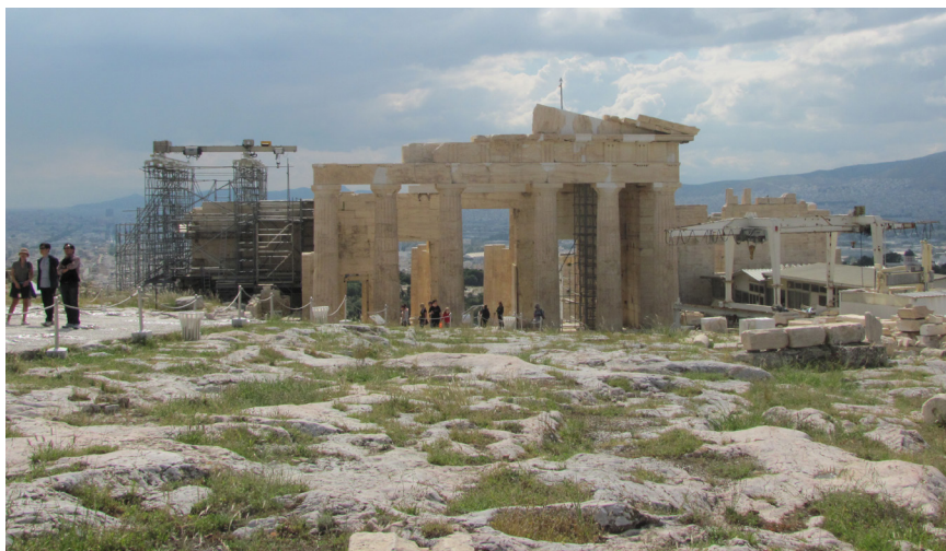
Obr.6 Pohľad na vstupnú bránu, propylon, z Akropoly. Archeologická lokalita Akropola v Aténach. Atény.

Svätyne sa vždy nachádzali v posvätnom priestore, ktorý musel byť označený a oddelený od profánneho sveta. Išlo o prosté vymedzenie posvätného a svetského. Jednoduché oddelenie za pomoci hraničných kameňov horoi neskôr bolo nahradené peribolom . Do posvätného priestoru sa vstupovalo cez monumentálnu bránu, propylon (obr.6). Táto brána nebola len miestom vstupu ale znamenala oveľa viac. Keďže prechodom cez propylon sa ľudia ocitli na posvätej pôde je pochopiteľné, že očista sa odohrávala práve tu. Pred vstupom na posvätnú pôdu sa každý návštevník bez ohľadu na iné prekážky musel umyť. Aj keď každá svätyňa mala svoje vlastné predpisy a zákazy, ktoré sa museli dodržiavať ak chcel návštevník vstúpiť, očista pred samotným vstupom bola nevyhnutnou záležitosťou. Bol to znak toho, že človek si je vedomí, že vstupuje do posvätného priestoru a chcel to dať aj najavo.