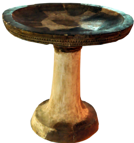
Obr.9 Perirrhantieron datovaný do neskorého archaického obdobia z Xanthos. Antalya archaeological museum.

Ich umiestnenie však nemusí byť striktné len pri hlavnom vchode. Pokiaľ išlo o samotný chrám, tam je umiestnenie perirrhantérií zrejme výslovne pri vchode. Avšak pri svätyniach, akou bola aj svätýňa v Eleuzíne mal perirrhantieron pravdepodobne aj inú funkciu. Používal sa pri iniciáciách, čiže pri zasvätení sa