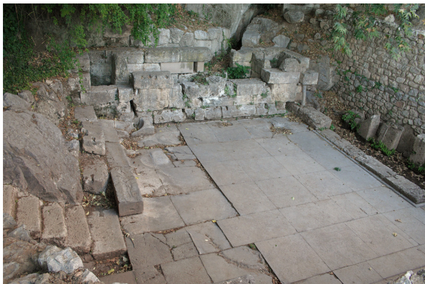
Obr.8 Cisterna na zachytávanie vody Kastalského prameňa v Delfách.

Perirrhanteria sa začínajú objavovať od archaického obdobia. V archaickom období mali však odlišný vzhľad ako v neskoršom, mladšom období. Ich podstavec tvorili najčastejšie tri korai , no neskôr sa zjednodušujú a nadobudnú tvar stĺpu (obr.9). Perirrhanterion v Istmii (obr.10) mal podstavec tvorený zo sôch, ktoré predstavovali takéto tri mladé dievčatá. Tieto ženské figúry v jednej ruke držali chvost a v druhej remeň kričiaceho leva. Motív troch žien a leva bol aj na perirrhanteriu zo Samu, v dnešnej dobe stratény. Tieto ženy majú predstavovať vládkyňu zvierat, Potnia Théron. 196 Nie je to však také jednoznačné. Stretla som sa aj s interpretáciou, že tieto korai by mohli predstavovať mladé nevydaté panny, ktoré držia misu s vodou. Často sú súčasťou sprievodu pri oslavách a ich čistota by mala byť symbolom čistoty vody, ktorú nesú. 197 Takýto podstavec tvorený ženskými postavami sa objavuje v 7. storočí pred Kr., no v priebehu 6. a 5. storočia pred Kr. sa zjednodušil. Ženské postavy sa zmenili na stĺp. Vzhľad bol podobný dnešným krstiteľniciam. 198 Okrem tradičného vzhľadu širokej misy na