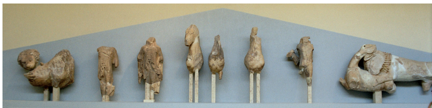
Obr.13 Štitová výzdoba z chrámu Apolóna Delfách (510-500 pred Kr.).