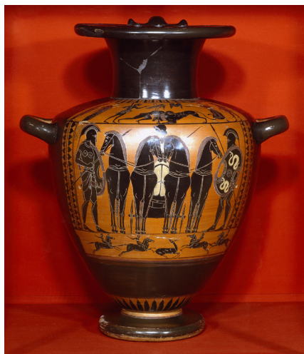
Obr.17 Zobrazenie Herakla v boji s némejským levom na pleciach atickej čier-nofigurovej hydrii (520 pred Kr.). Foto: © Thorvaldsen Museum. Licencia: Public domain.

Zobrazenia pri Heraklovi bývajú podobné v chrámovej výzdobe ako na nádobách. Heraklové úlohy sa na hydriách začínajú objavovať už od 6. storočia pred Kr. avšak najviac ich máme z obdobia 5. storočia pred Kr. Najpočetnejšie je zastúpené vyobrazenie Herakla s némejským levom (obr.17). Objavujú sa však aj iné úlohy, napríklad boj s erynantským diviakom, zobrať jablka Hesperidiiek alebo boj s krétskym býkom. Všetky tieto nálezy pochádzajú z 5. storočia pred Kr., čiže z obdobia klasiky.