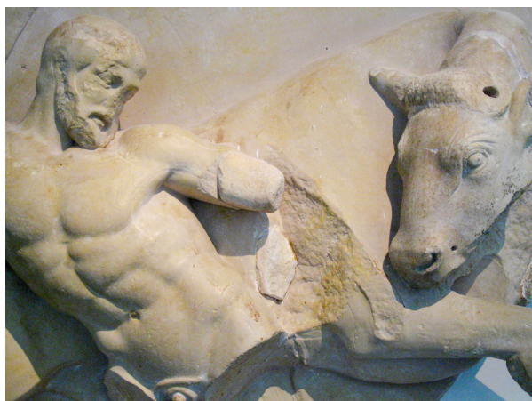
Obr.14 Herakles s krétskym býkom z chrámu Dia Olympského (5.storočie pred Kr.).

očisty. Reliéf (obr.12) zobrazuje mužov, ktorí nesú v sprievode hydrie (gr. υδροφόροι ). Títo muži nesú v hydriách vodu, ktorú budú potrebovať pri festivale, počas vykonávania obety ale aj pre rituálnu očistu. Je to výnimočná scéna už len z toho hľadiska, že sú tam zobrazení muži a nie ženy. 213 Na rozdiel od žien, ktoré nesú hydrie na hlavách, muži ich nesú na pleciach. 214 Keďže sú tu zobrazení účastníci sprievodu náboženského festivalu je pravdepodobné, že museli už podstúpiť očistu. Aj keď vodu, ktorú nesú môžu neskôr použiť pri očiste, už samotný fakt, že sú zapojení do príprav festivalu na počesť patrónky mesta a sú súčasťou sprievodu znamená, že musia byť toho hodní, musia byť na to pripravení. Účastníci osláv na počesť boha vždy musia byť čistí, inak by sa nemohli zúčastniť.