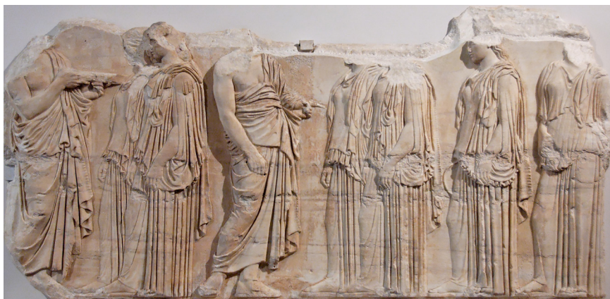
Obr.2 Časť východného vlysu z Partenónu zobrazujúca tkáčky (445–435 pred Kr.). Louvre.

Nový rok prinášal Panaténaje, ktoré sa uskutočňujú 28. Hekatombaiona na oslavu víťazného triumfu Atény v boji medzi bohmi a gigantmi. Tento boj bol zobrazený aj na jej utkanom rúchu. Každé štyri roky sa organizovali Veľké Panaténaje, ktoré trvali týždeň. Bola to prehliadka veľkoleposti a množstva súťaží. Víťazí týchto súťaží dostávali amfory plné najkvalitnejšieho olivového oleja ktoré nazývali príznačne - panaténajské amfory. 103 Najvýznamnejšou časťou panaténajských slávností bol sprievod, ktorý viedol od Dipylskej brány po posvätnej ceste cez keramickú štvrt a agoru až na Akropolis. Tento sprievod je zobrazený na vlyse z Partenonu (obr.2) a v procesii boli aj zástupcovia významných aténskych rodín. Keď prišiel sprievod na Akropolis až potom bola socha Atény z olivového dreva oblečená, prvýkrát od plynterion . Medzitým sa konala veľká obeta, pri ktorej bolo mäso rozdelené občanom mesta. Celú organizáciu osláv mali na starosti jednotliví úradníci. Tí, ktorí sa starali o obeť sa nazývali hieropoioi , čiže tí, ktorí majú na starosti sväté veci. 104 Ďalším sviatkom, ktorý má špecifický úkon očisty je oslava boha Herma. Mesto si vybralo najkrajšieho mladíka, ktorý niesol na pleciach jahňa popri mestských hradbách. Bolo to na znak toho ako Hermes odvrátil mor od mesta tým, že odniesol barana. Tento rituál preto môže byť považovaný za očistný. 105 Spomína ho Pausánias vo svojej deviatej knihe (Paus.9.22). Očista sa mohla