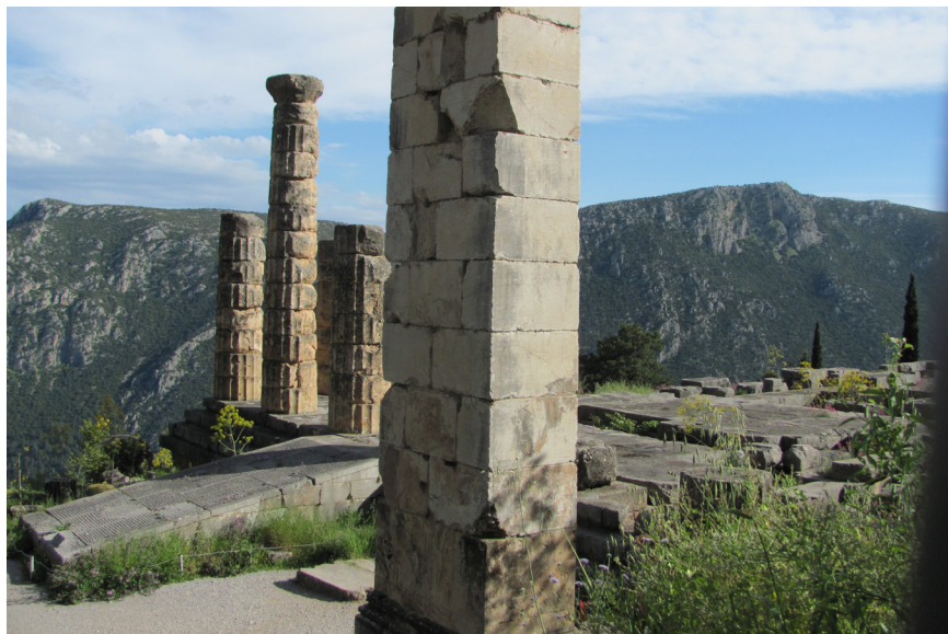
Obr.5 Rampa do chrámu Apolóna v Delfách. Archeologická lokalita Delfy.