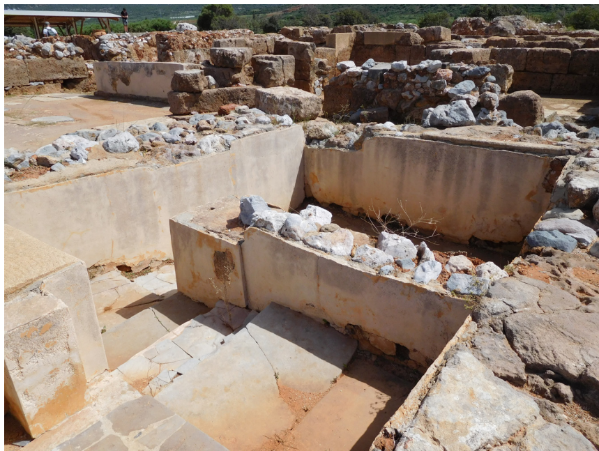
Obr.7 Lustrálny bazén v Malii. Archeologická lokalita Malia.

Tie najvýznamnejšie svätyne vznikali na miestach, ktoré predpokladali najvhodnejšie podmienky. Jednou z nich bol aj prírodný zdroj vody, ktorá väčšinou stekala z najbližšej hory dole ku svätyňi. Tieto prírodné pramene potom Gréci vedeli šikovne využiť a za pomoci vybudovaných kanálov rozviesť po areály svätyne. Asklépeion v Epidaure je pekným príkladom takéhoto využitia minerálneho prameňa, ktorý stekal z hory Kynortion a za pomoci systému kanálov si Gréci vytvorili dva zdroje, z ktorých mohli čerpať vodu. Nachádzali sa v severovýchodnej časti svätyne a nazývali sa Dórsky prameň a Posvätný prameň. 182 Samotná vodná nádrž sa nemusela nachádzať priamo v temene. Príkladom je Apolónova svätyňa v Delfách. Nachádzal sa tu Kastalský prameň (obr.8), ktorý stekal z hôr. Bol situovaný asi päťsto metrov od vstupu do svätyne, čo malo vcelku praktický význam pri očiste, ktorá sa mala vykonať pred vstupom do svätyne. Jeho voda však bola využívaná aj pre potreby celej svätyne (Paus.10.8).