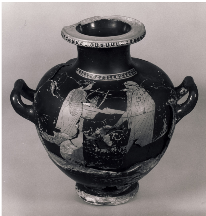
Obr.16 Zobrazenie Apolóna s phialou a kitarou na červenofigúrovej hydrii (480-460 pred Kr.)

Pri hydriách už poznáme veľké množstvo výjavov. Príkladom pre mytologické námety je Orestes, ktorý po vražde svojej matky prepadol šílenstvu, neskôr vyzdravel a vykonal obeť, aby sa očistil od matkovraždy (Paus.8.33). Dalším mytologickým príbehom, kde hlavný hrdina musel podstúpiť očistu bol príbeh Oidipa, ktorému osud určil zabiť otca. Musel sa zbaviť zlého ducha za otcovraždu a tak musel podstúpiť rituál očisty. Aj Apolón sa po vražde Pytona musel očistiť. Dokonca aj známy grécky heros Herakles podstúpil proces očisty v podobe dvanástich úloh.