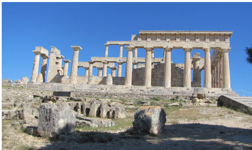
Obr.4 Rampa do chrámu Atény Afáje na Aigíne. Archeologická lokalita chrám Atény Afáje na Aigína.