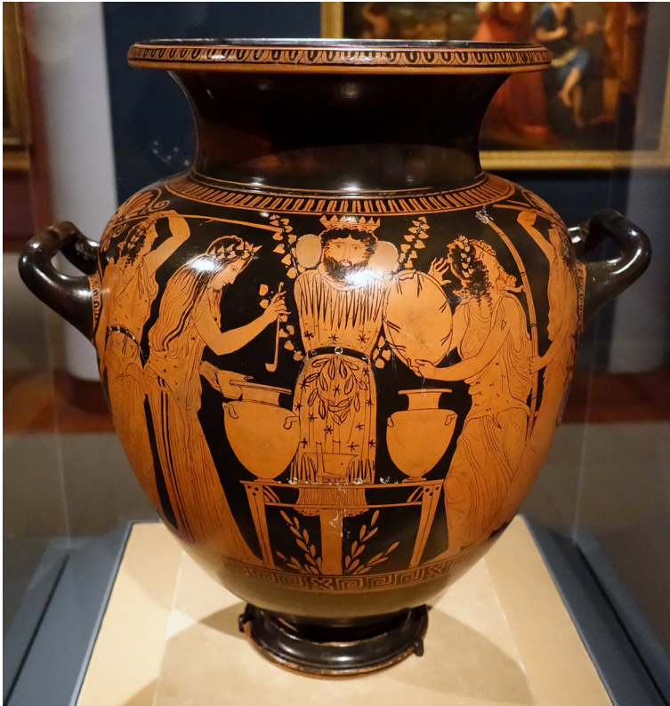
Obr.1 Lenaiská červenofigúrová váza so ženami naberajúcimi víno a stĺp s maskou Dionýza. Pripisované Diňos maliarovi (430-420 pred Kr.). Princeton University Art Museum.

rodina doma pripravila vlastnú obeť. Uvarili v nádobe jedlo so všetkých druhov obilia a obetovali ho chthonickému Hermovi. Pri západe slnka sa hlava rodiny prechádzala po všetkých izbách v dome a kričala: „Von z dverí, duchovia. Anthesteriá sa skončili!“. Na záver bola ešte vykonaná obeť pre mainádu Erigone, ktorá sa obesila po tom, čo zomrel jej otec Icarius, ktorému Dionýzos daroval víno. Obetovali jej jedlo. 86