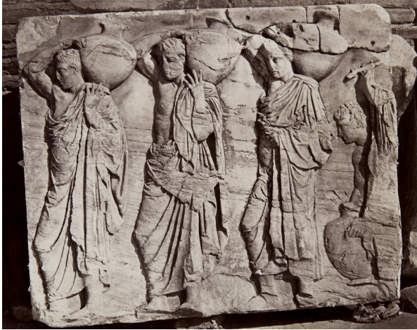
Obr.12 Scéna nosičov hydrii z Partenonského vlysu. Akropoliské múzeum.